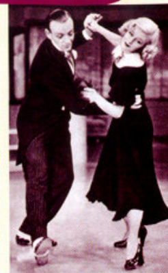
Fred Astaire et Ginger Rogers : et vive les claquettes

Il faut cibler ! La sélection d'œuvres et de documentaires est compliquée : entre les désirs des résidents, l'attrait de la nouveauté, les quelques limitations du catalogue... il n'est pas toujours facile d'établir le programme. Mais le nombre de personnes présentes régulièrement, l'intérêt que chacun manifeste font de cette activité un magnifique support à l'animation. ■