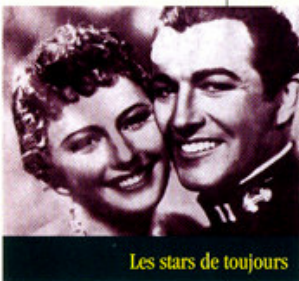
Les stars de toujours